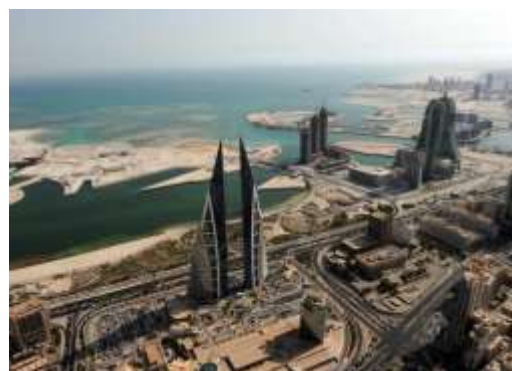
Ночь в Бахрейне, отель 5*